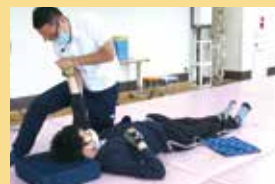
マット上での動作訓練