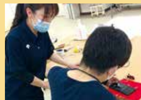
携帯電話の活用訓練

整容動作(歯磨き、髭剃り等)や食事、トイレ、入浴、更衣など日常生活に関わる動作の獲得を目指し、訓練します。