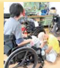
車いすの作製相談

寝返りなどの基本動作、車いすからベッドへの乗り移りなど残存機能に応じた動作の獲得を目指して訓練し、車いすの調整も行います。