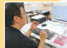
自助具を使用したパソコン操作