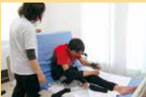
更衣訓練(靴下はき)