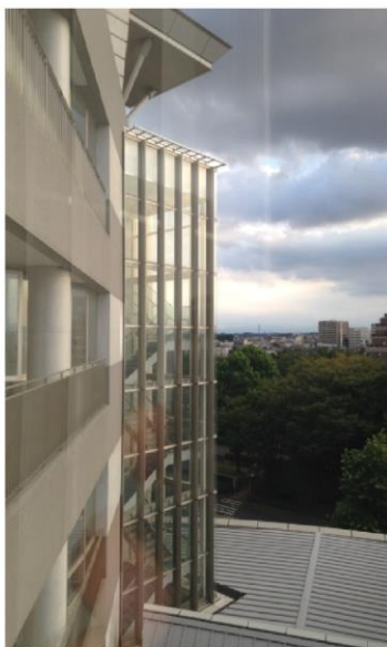
教室窓から見た風景