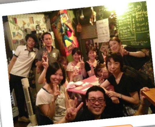
たまにはみんなで夕飯！