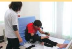
更衣訓練(靴下はき)