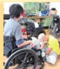
車いすの作製相談

寝返りなどの基本動作、車いすからベッドへの乗り移りなど残存機能に応じた動作の獲得を目指して訓練し、車いすの調整も行います。