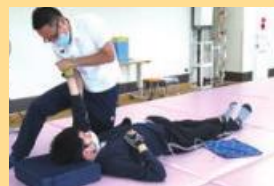
マット上での動作訓練