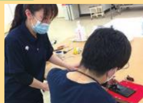
携帯電話の活用訓練

整容動作(歯磨き、髭剃り等)や食事、トイレ、入浴、更衣など日常生活に関わる動作の獲得を目指し、訓練します。