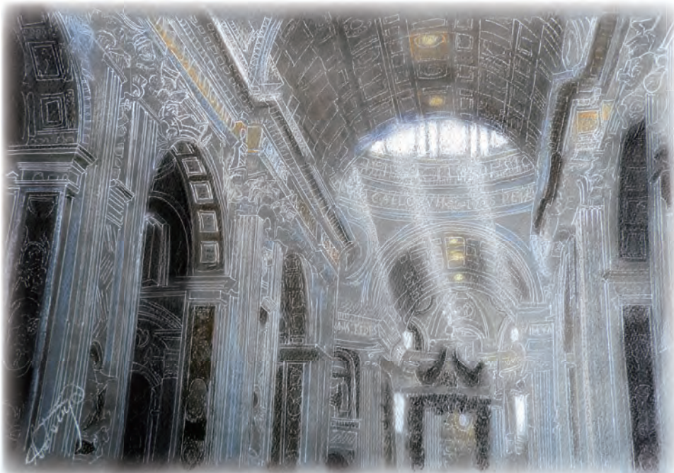
「光のあるうちに」教会が好きです。光が差し込む様子を描きたくて手掛けた作品です。