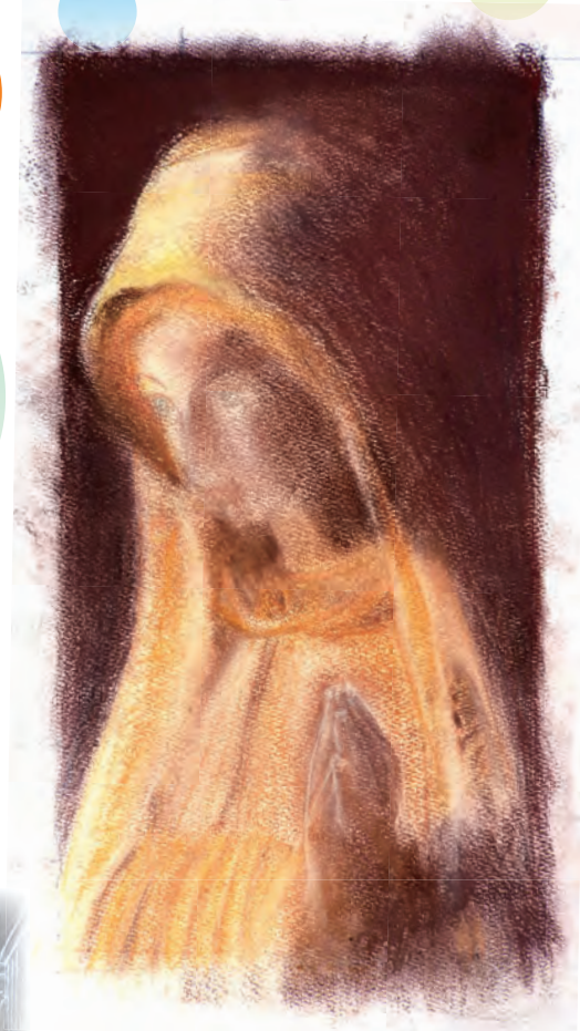
「マリア様と」憧れの女性像であるマリア様。 祈りの姿を心を込めて描きました。