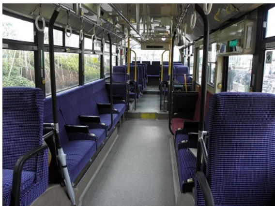
「のぞみ大学」行きのバス車内