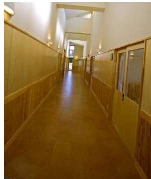
廊下（静養室⇔作業室）