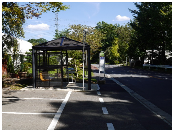
バス停「のぞみ大学前」