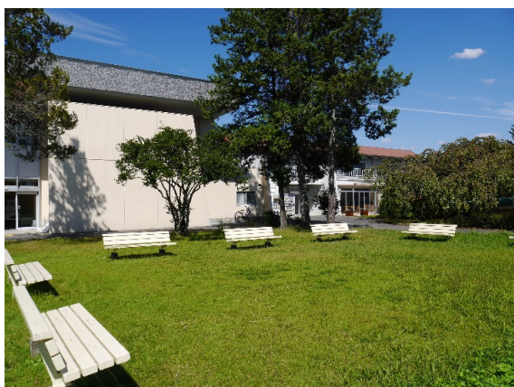
学生食堂前の広場