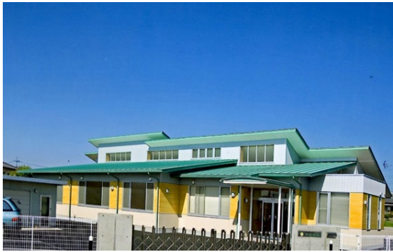
生活介護事業所「あじさい」全景