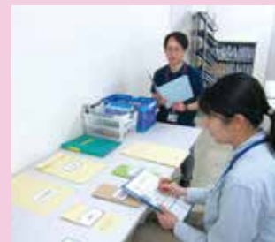
センター内職場実習