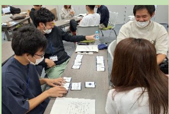
もしバナゲーム体験