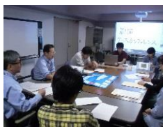
ケースカンファレンス