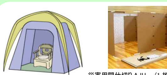
災害用間仕切りAJU (1枚4,000円)