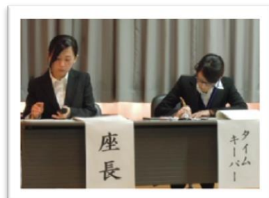
座長とタイム キーパーも自分達 で行いました