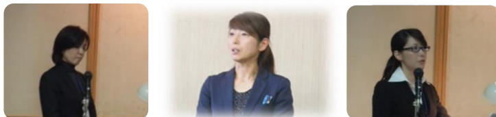
質問にも落ち 着いて答えるこ とができました