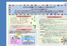
リーフレット(A4両面1枚)