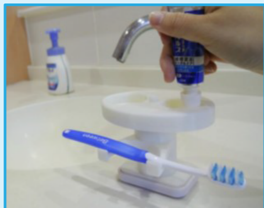
片麻痺の方の為のキャップオープナー