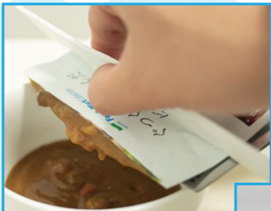
片手で使えるパウチホルダー