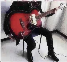
片手で弾けるギター