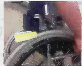
車いす用クリーナー