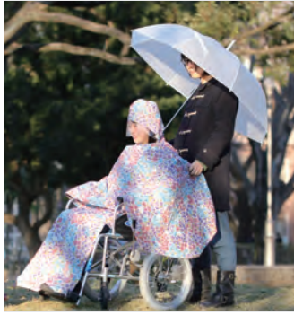
車椅子用レインコート