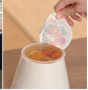
片麻痺患者のための容器開封補助具