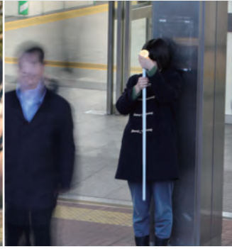
外出支援のための白杖用ライト