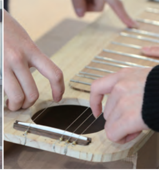
複数名で演奏する楽器