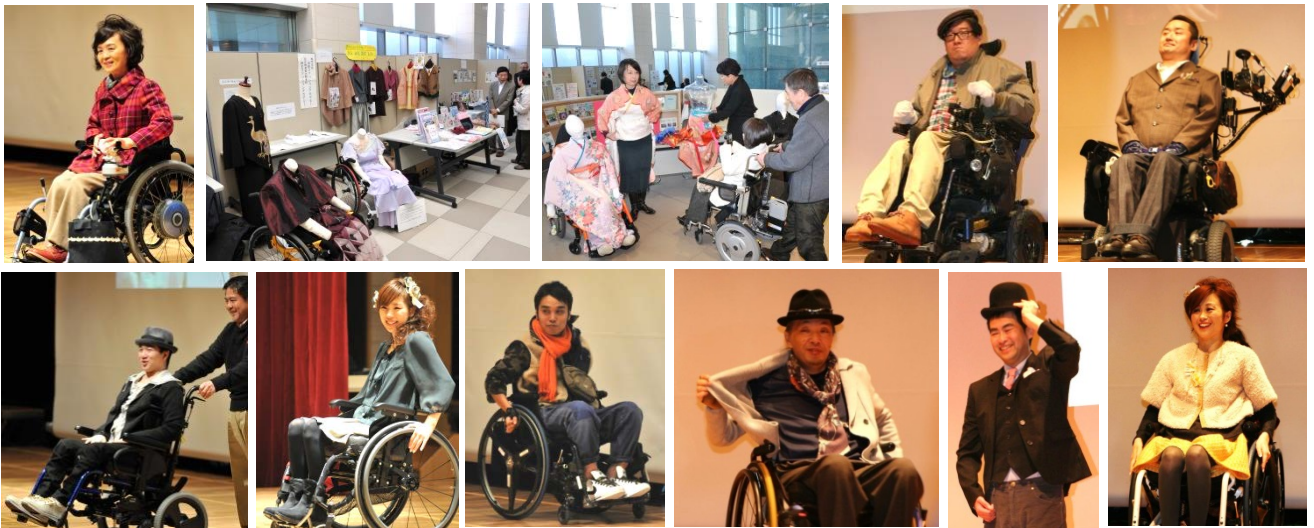
写真：国リハコレクション2012 「気楽におしゃれ、始めませんか」ファッションショーと展示より