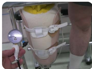
陰圧: 強 -90kPa 剛性が高まり、断端形状がモールドされる