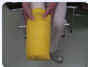
陰圧: 弱 0kPa 軟質