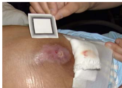
大転子部位に生じた浸出液がある褥瘡

褥瘡(じょくそう、床ずれ)は運動麻痺があり、一定時間、同じ姿勢で同じ場所に圧力を受けつづけるなどして、血流が停止し、細胞や組織が壊死することから生じる皮膚潰瘍です。重篤な褥瘡の治療には、除圧や手術が必要です。周辺から大きな筋肉をもつ組織を移植する手術は、負担が大きいと共に、治癒まで長期間の療養を必要とし、就労継続を難しくすることもあります。