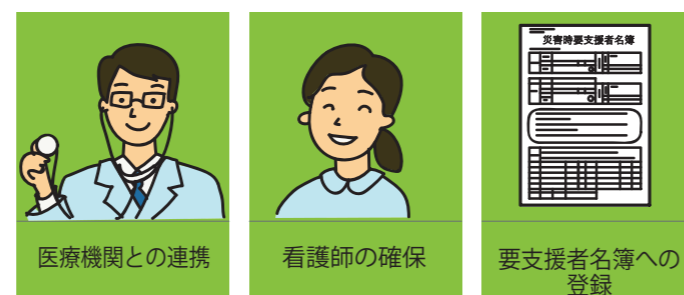
医療機関との連携