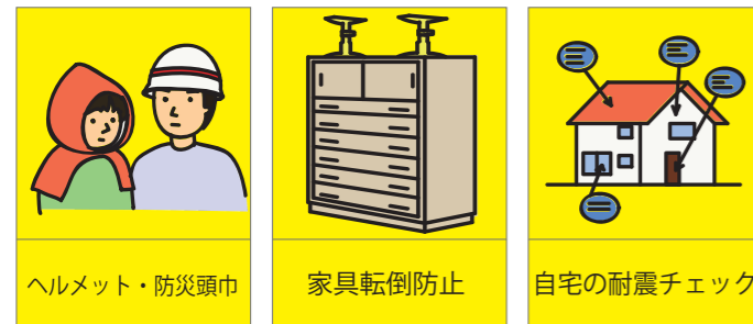
ヘルメット・防災頭巾