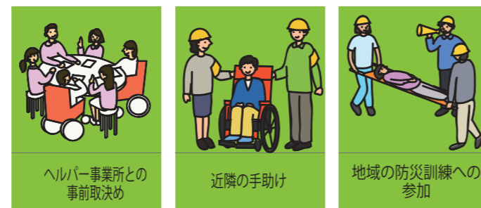
ヘルパー事業所との事前取決め