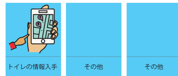
トイレの情報入手