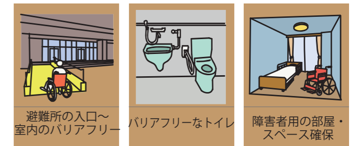
避難所の入口～室内のバリアフリー