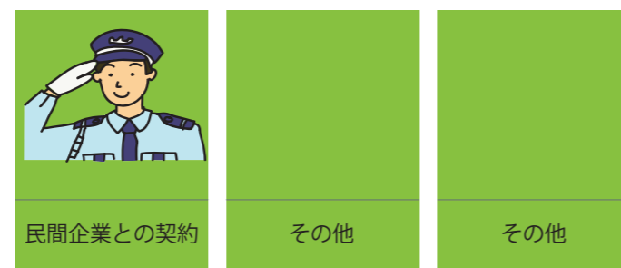
民間企業との契約