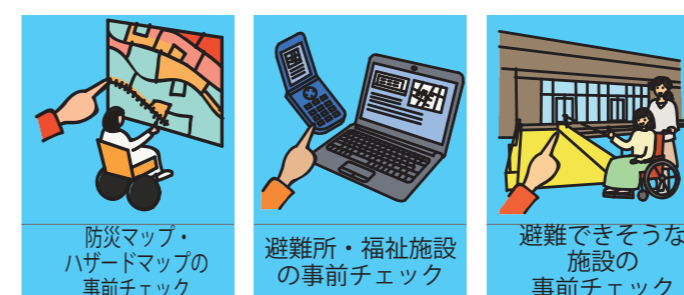
防災マップ・ハザードマップの事前チェック