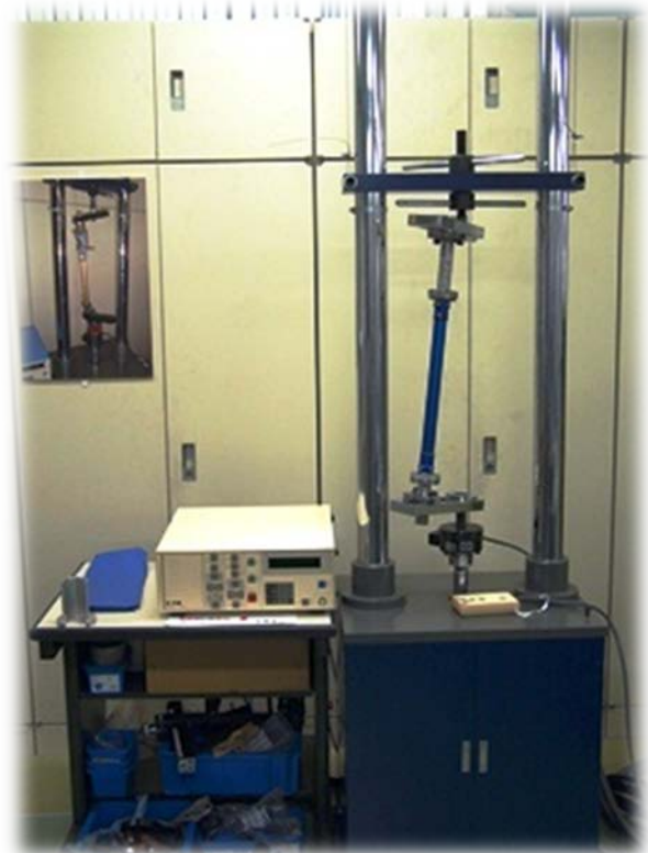
義足一体構造試験装置 繰り返し試験用 (JIS T0111)