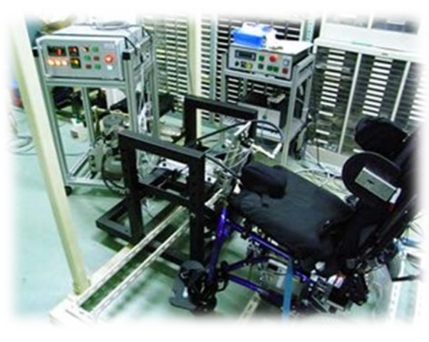
座位保持装置用耐荷重試験装置 (座位保持装置の認定基準)