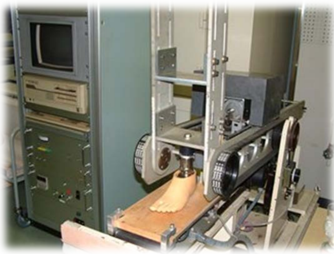
義足足部歩行繰り返し試験機 (JIS T9212)