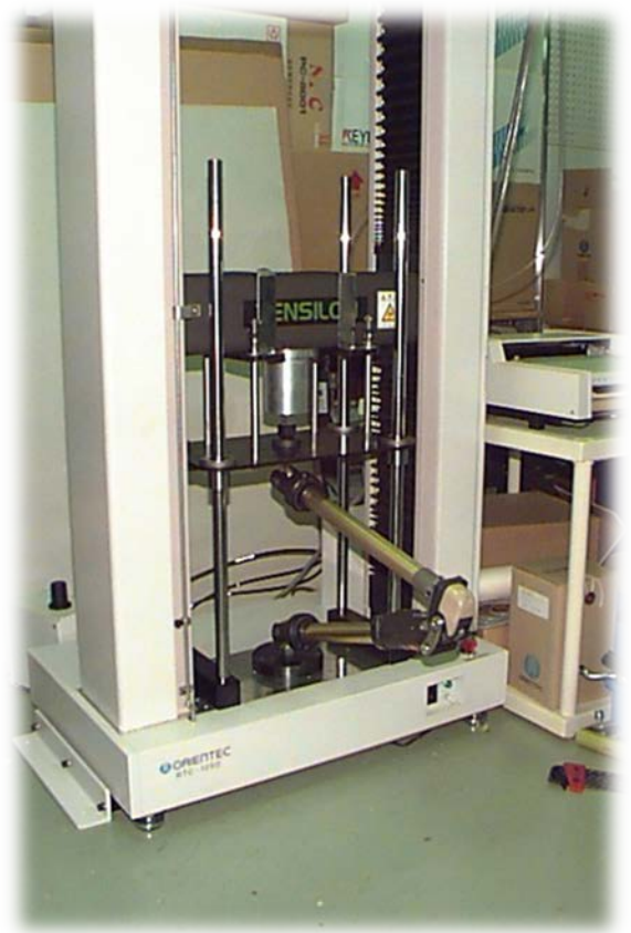
膝最大屈曲止め試験装置 (JIS T0111)