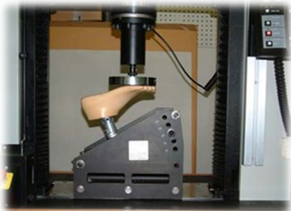
義足足部の変形量の測定 (JIS T9212)