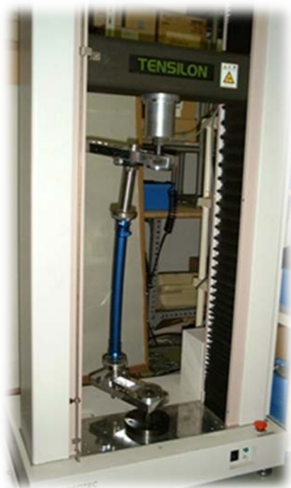
義足一体構造試験装置 静的試験用 (JIS T0111)