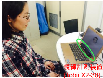
視線計測装置 (Tobii X2-30)